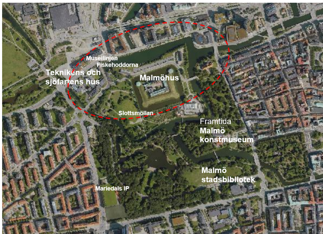
Orienteringskarta med den huvudsakliga geografiska omfattningen av planprogrammet markerad med röd streckad linje.

I ett större perspektiv utgör området en del av "Kulturstråket" genom staden, som knyter ihop ovan nämnda institutioner med bland annat Malmö opera och Malmö konsthall.