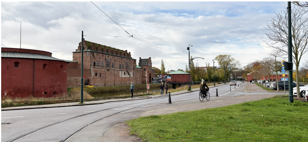
Malmöhusvägen sedd från öster.

Det sammanlänkande läget till trots är kopplingarna mellan området och omgivningarna idag inte så tydliga. Det samma gäller för kopplingarna mellan de olika målpunkterna inom området.