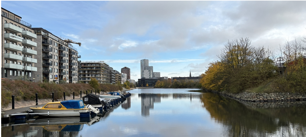
Kanalen norr om Malmöhus, sedd från väster. Citadellskajen till vänster i bild, museiområdet till höger i bild.